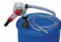
Handkurbelpumpe Leistung ca. 0,38 l/Umdrehung