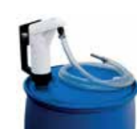
Hebel-Handpumpe Leistung 0,3 l/Hub

Das 210 Liter Fass ist die ideale Lösung für Betriebe mit (noch) geringem Bedarf. Sie können AdBlue® einfach fassweise nachbestellen und somit Ihren Bedarf sicher abdecken. Wählen Sie aus einem breiten Sortiment an Pumpen und Zapfpistolen die für Sie passende Kombination.