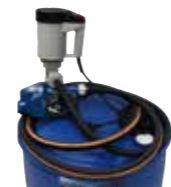
Fasspumpe Leistung ca. 25 l/min